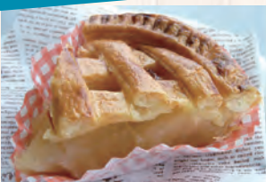
大人気！数量限定！ 手作りアップルパイ