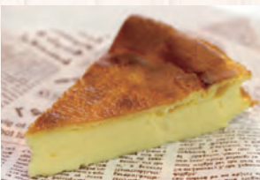
手作り チーズケーキ