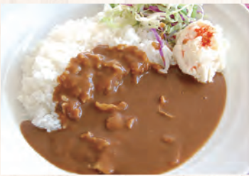
白馬豚をたっぷり使った 白馬豚カレー