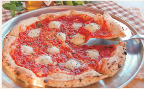
マルゲリータ (モッツアレッチーズ、ドライバジル、トマトソース)