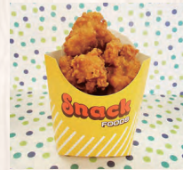
鶏のからあげ ¥400 Chicken Karaage