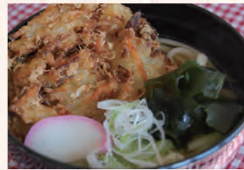
野菜かき揚げうどん