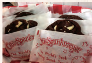
お店で焼いています！ チョコクッキー他