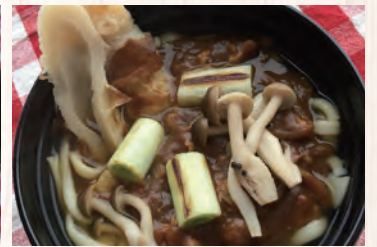
長野県あるある「ピタチくわ」入 カレーうどん (白馬豚入)