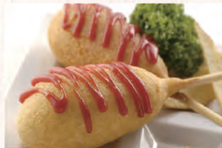
アメリカンドッグ