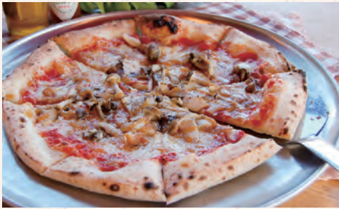
信州三拍子ピッツア (きのこ・りんご・みそ、トマトソース)