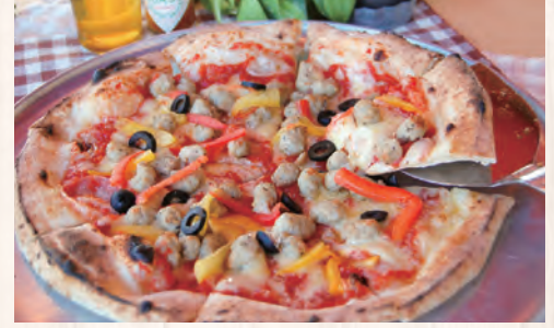
ソーセージピッツア (野菜、ソーセージ、オリーブ、トマトソース)