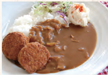
ボリュームたっぷり！ 白馬豚メンチカツカレー

Pork Curry and Rice with minced meat cutlet